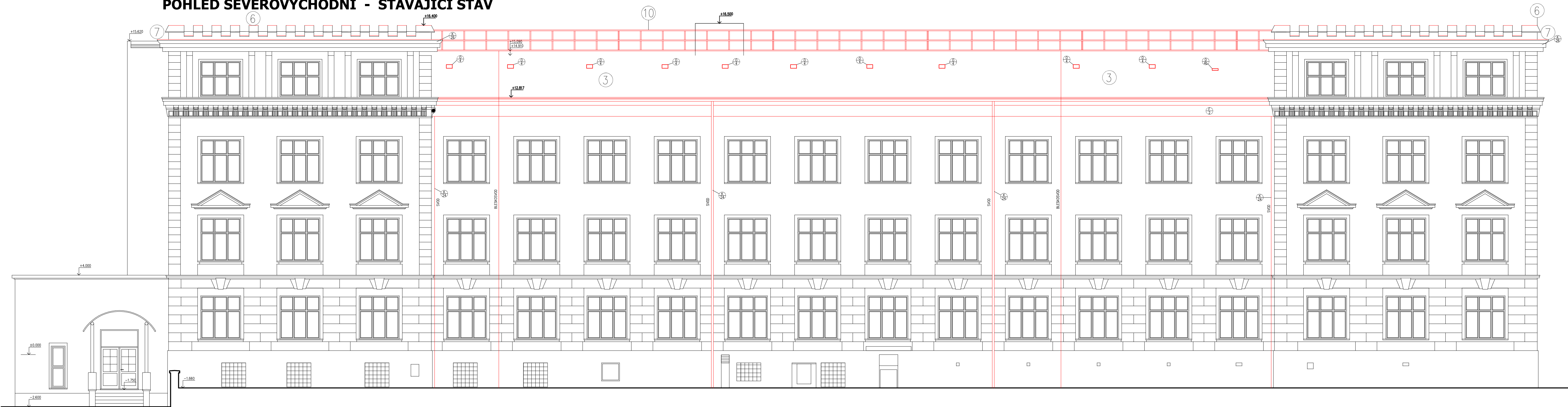
POHLED SEVEROVÝCHODNÍ - STÁVAJÍCÍ STAV